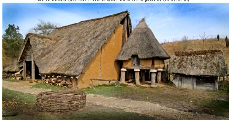
Parc de Samara (Somme) : reconstitution d'une ferme gauloise (50 av. J.-C.)

Source : fouilles d'archéologie préventive réalisées par l'Inrap sur le site de la Joinchère.