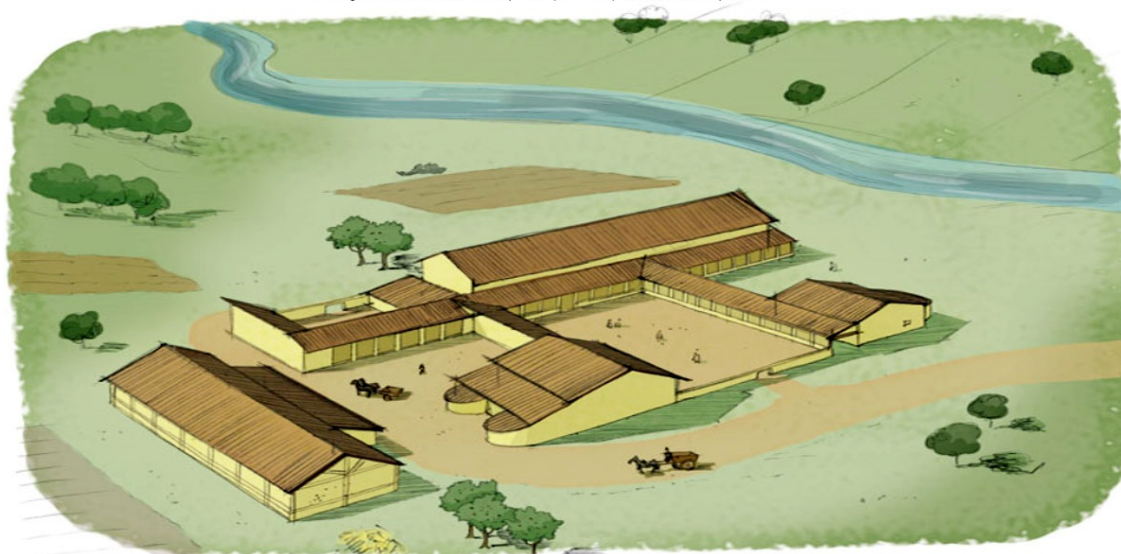
Villa gallo-romaine de Lalouette (Ardèche) au IIe siècle après J.C.

Crédit : dessin de Cire (www.cirebox.com)