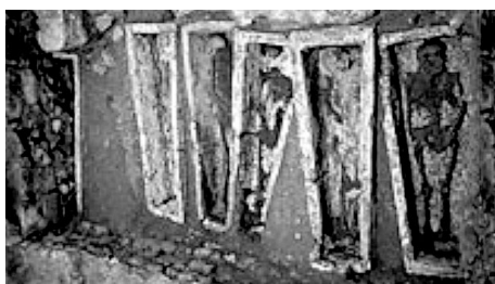
sépultures de moines