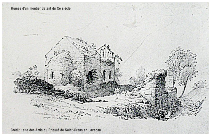
Ruines d'un moutier, datant du Xe siècle